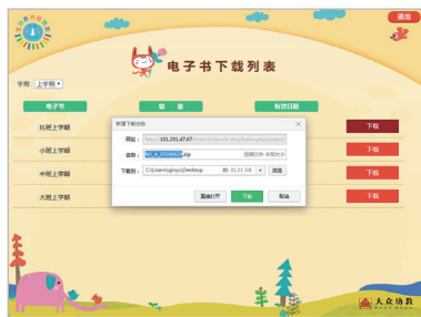
选择合适的路径存档

下载完成后，双击安装软件，按照页面提示完成安装，每个账号可在 3 台设备上运行安装。